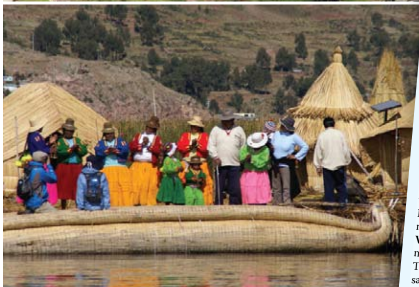
Na Titicaci, najvišem plovnom jezeru na svijetu, nekoliko je otoka. Najpoznatiji su ploveći otoci Uros, koji se po potrebi mogu i preseliti, a lokalni muškarci, izrađuju ih i obnavljaju od trstike koja raste u jezeru. Na otoku Taquile pak, muškarci pletu. Svi su iznimno iznimno gostoljubivi i srdačni, a žene unose dodatnu vedrinu svojom odjećom živih boja. Jedna od karakteristika Perua su i raznoliki šeširi i kape koje se razlikuju od kraja do kraja, od sela do sela.