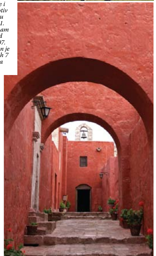
Grad u gradu. Tako bi najlakše mogli opisati samostan Santa Catalina u Arequipi. Mnoštvo prolaza, uličica i trgova karakteriziraju vedre boje, kao suprotnost samoj Arequipi, poznatog kao bijeli grad. Arequipu nadvisuju čak tri vulkana, a obližnji kanjon Colca dom je kondora.