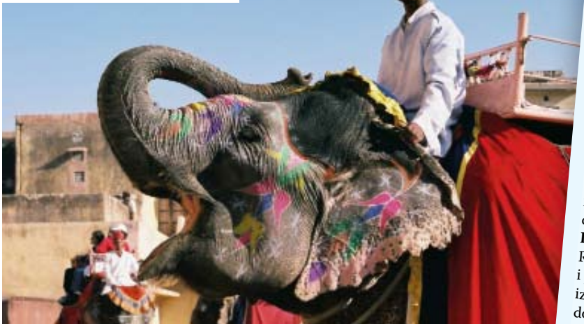
Raznolikost i šarenilo Indije očituju se na svakom koraku. Šarena odjeća vlada ulicama, posebno u žena, najčešće omotanih u 5 metara duge sarije. Njihovo čelo često krasi bindi, danas modni ukras, dok u hinduističkoj tradiciji ukorijenjena tika ili tilaka, smještena između obrva, simbolizira treće oko i znak je duhovnosti. Šareno je i sve ostalo - slonovi, festivali i plesovi, posebno kathakali s juga zemlje u kojemu plešu muškarci obojena lica i bogatih kostima.

PONAŠANJE – Kaže se „Kada u Rimu, ponašaj se kao Rimljanin“. Pokušajte s indijskim pozdravom. Sklopite ruke i podignite ih prema licu, a glavu lagano naklonite. Pri tom izgovorite „Namaste“. Ovaj ljupki pozdrav razveselit će vaše domaćine i pokazati im da ih cijenite. Indijci su konzervativni u odijevanju te ako niste na plaži, prilagodite se. Kratke hlačiće i majice s bretelama ostavite u hotelu. I ne zaboravite! Za hinduiste su noge najprljaviji dio tijela. Sjedite li na podu, svakako ih savinite uz sebe jer upiranje njima u drugoga, nepristojno je.